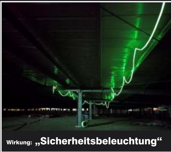
Wirkung: „ Sicherheitsbeleuchtung “