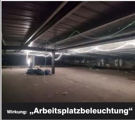
Wirkung: „ Arbeitsplatzbeleuchtung “